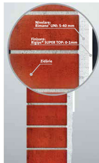
Nivelare: Rimano® UNI: 5-40 mm Finisare: Rigips® SUPER TOP: 0-1 mm Zidărie